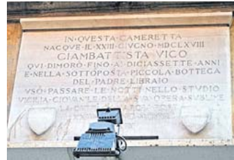
Die Gedenktafel am Geburtshaus Giambattista Vicos in Neapel.

Aber seine Antwort ist richtig schräg. Er wendet die Philosophie von der Natur auf die menschliche Welt, die er „mondo civile“ nennt. Damit meint er alles, was der Mensch, als Bewohner einer civitas (oder polis), geschaffen hat oder schafft, und wird auf Deutsch am besten mit „gesellschaftliche“ oder „politische Welt“ wieder-